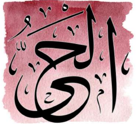
Al-Hayy, attribut d'Allāh

Tel est l'exemple inspirant de générosité, de bonté et de bienveillance envers les pauvres, ainsi que de confiance absolue en Allāh le Tout-Puissant, que nous a laissé Hadrat Maulvi Hakim Nooruddin (ra).