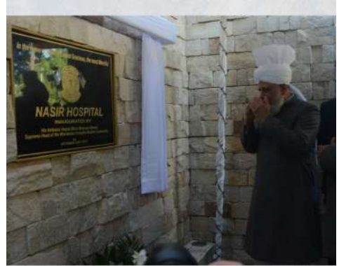
Huzoor (aba) lors de l'inauguration de la 'Nasir Hospital' au Guatemala en 2018

À ce propos, notre bien-aimé Huzoor (aba) a déclaré au cours de l'inauguration de la 'Nasir Hospital' au Guatemala en 2018, que seule une personne qui a un amour sincère pour l'humanité et ressent l'angoisse de la création de Dieu peut être attentionnée et sympathique, comme le veut le Coran. Un amour aussi profond pour l'humanité n'est possible que si le cœur est pur et exempt de malice et d'égoïsme.