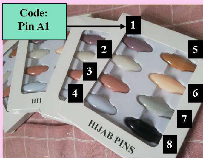
Hijab Pin A

Bane modèles pins ki toujours disponibles!