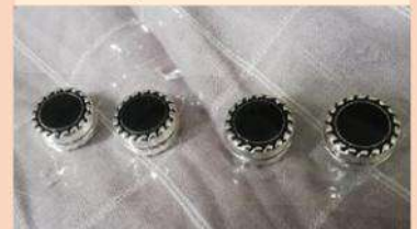
Hijab Pin E